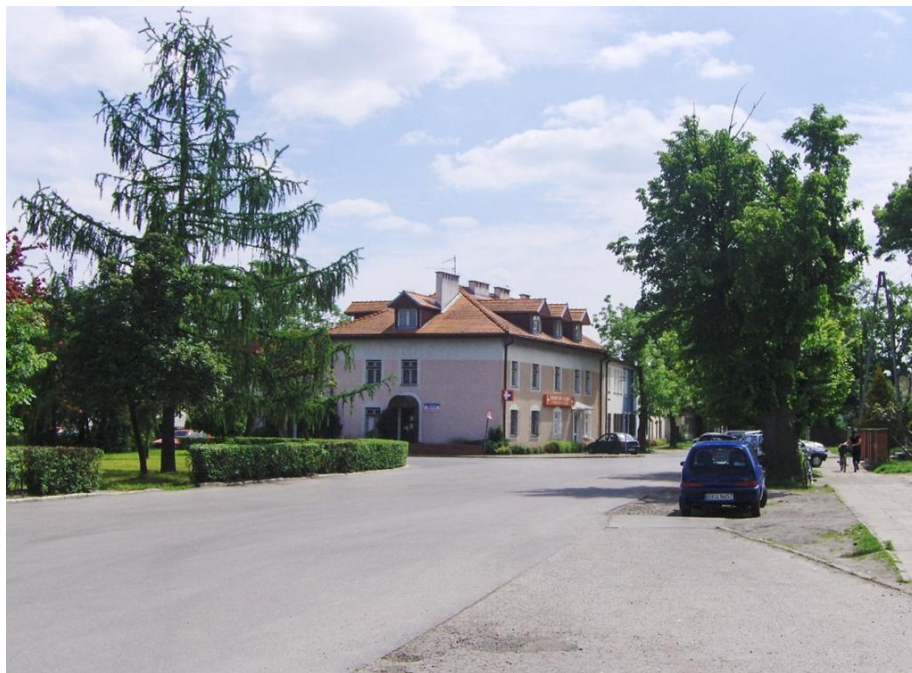
Fot. 2 Widok centrum Ostrowy - Cukrowni