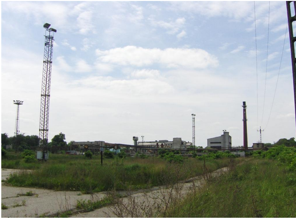
Fot.1 Park przemysłowy byłej cukrowni