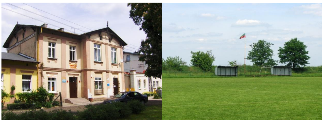
Fot. 6 i 7 Budynek świetlicy, po prawej boisko LKS „Ostovia”

Działalność kulturalna i zajęcia świetlicowe prowadzone są w ramach istniejącej w Świetlicy Środowiskowej w miejscowości Ostrowy - Cukrownia. Świetlica stanowi również siedzibę Stowarzyszenia na Rzecz Rozwoju Gminy Nowe Ostrowy.