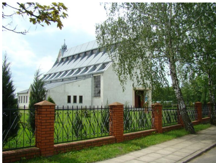
Fot 5. Kościół parafialny

Na terenie miejscowości znajduje się Kościół parafialny p.w. Matki Boskiej Częstochowskiej. Jest to stosunkowo młoda parafia, gdyż erygowana została dnia 1 czerwca 1984 r., natomiast sam budynek kościoła, będący ciekawym urbanistyczno-architektonicznym obiektem powstawał w latach 1986-1996 przy dużej pomocy ludności sołectwa.