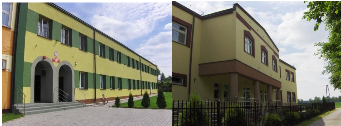
Fot. 3 i 4 Budynek szkoły podstawowej oraz gimnazjum

Obecnie szkoła podstawowa jest prowadzona przez samorząd gminny. Uczęszcza do niej 191 uczniów do klas I- VI oraz 22 dzieci w oddziale „0”. Radę Pedagogiczną stanowi grupa wykwalifikowanych i doświadczonych nauczycieli.