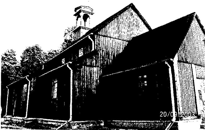
Kościół parafialny w Grochowie