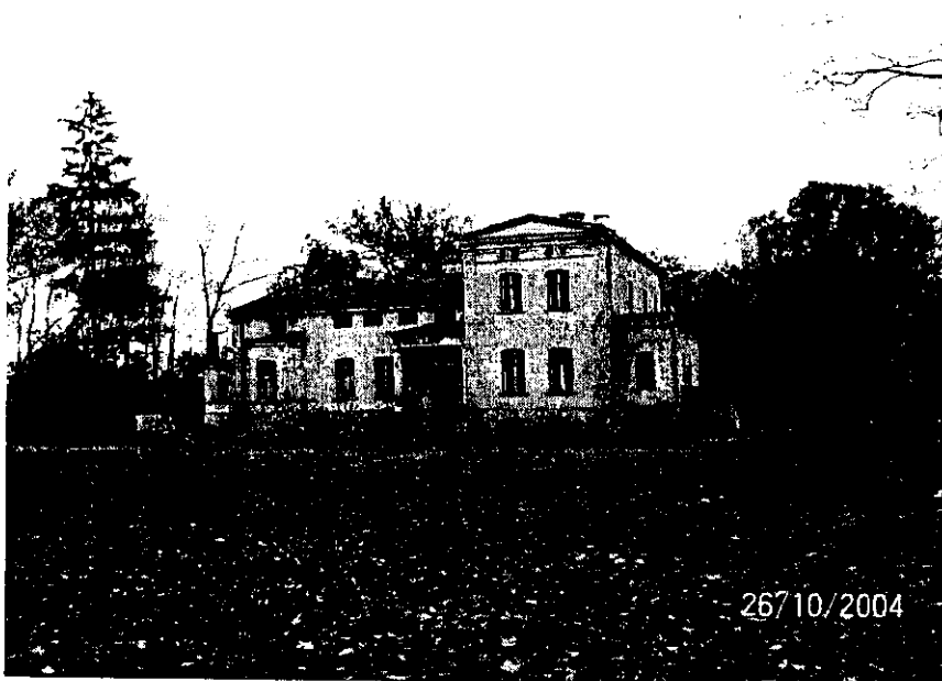
Dwór w Grochowie