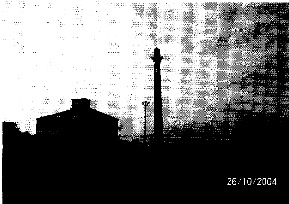
Cukrownia „Ostrowy” - największy zakład pracy w gminie