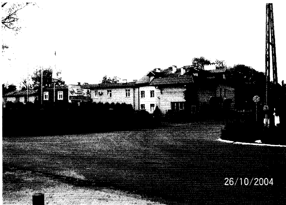
Siedziba Cukrowni „Ostrowy” - centrum miejscowości Cukrownia Ostrowy