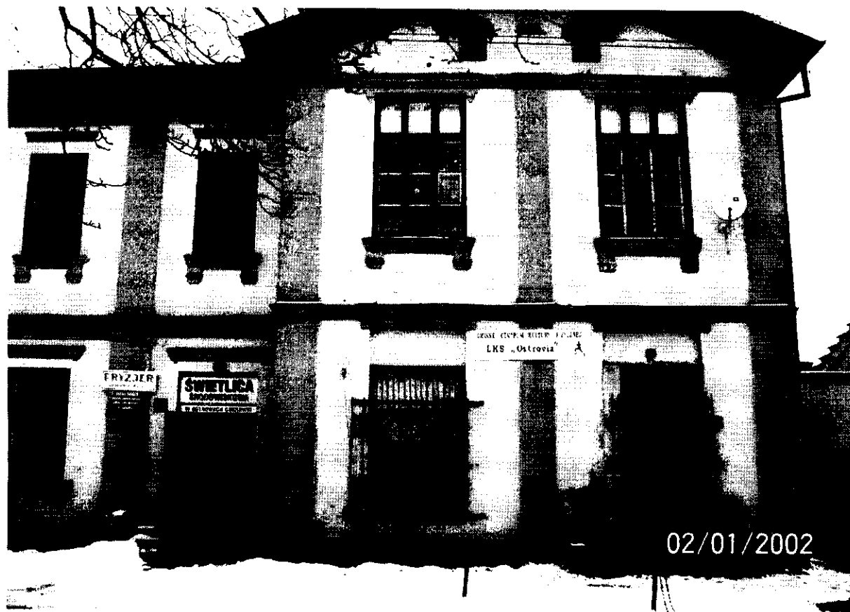
Budynek , w którym mieści się Świetlica Środowiskowa w Cukrowni Ostrowy

Budynek w którym obecnie mieści się Świetlica Środowiskowa został wybudowany w roku 1908. Jest to budynek piętrowy o ogólnej powierzchni użytkowej ok. 240 m 2 i kubaturze ok. 700 m 3 .