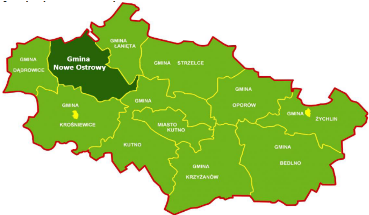
Rysunek 1. Położenie gminy Nowe Ostrowy na tle powiatu kutnowskiego